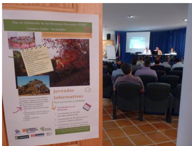
Manzanera, 14 de septiembre de 2012

Se informa que la producción de biomasa constituye actualmente un área en estudio, tanto a nivel comarcal como privado. No obstante se avisa que las opciones que se están barajando no son demasiado competitivas y precisan de un aprovechamiento excesivamente intensivo y probablemente poco sostenible desde el punto de vista económico y ambiental. Se abre un debate en el que se hace referencia a la viabilidad de los proyectos y a estudios que se han realizado, promovidos por iniciativa privada y por el Gobierno de Aragón. De cualquier forma, esta medida se contempla en el texto del PORF y se debatirá con detalle en los talleres.